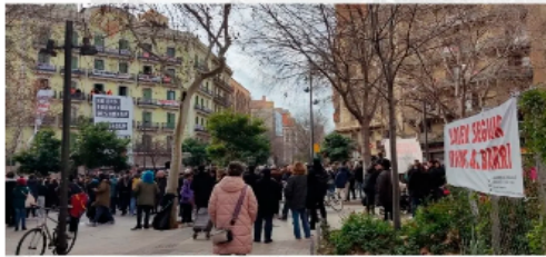
Fotografia: Concentració per aturar el desnonament de Casa Orsola

Ens alegrem que el veïnat de Casa Orsola no hagi de marxar. És una victòria de la nobilització popular liderada pel Sindicat de Llogateres i en la que hem participat intensament com a Favb i com associació de veïnals. Hi ha moltes més Cases Orsola a Barcelona i aquesta solució no podrà ser per totes.